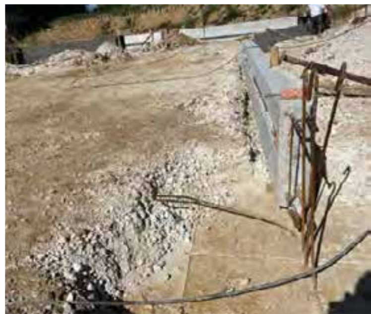
Longrines préfabriquées sur le chantier.