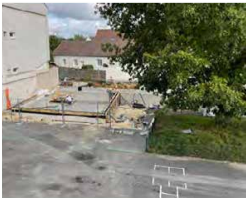
Dallage coulé à l'emplacement du futur ascenseur.

Jusque-là pas de mauvaises surprises ! Selon le planning, le maçon, après avoir réalisé l'ensemble du dallage et l'ossature béton des niveaux, laissera la place au charpentier pour la nouvelle année 2024 !