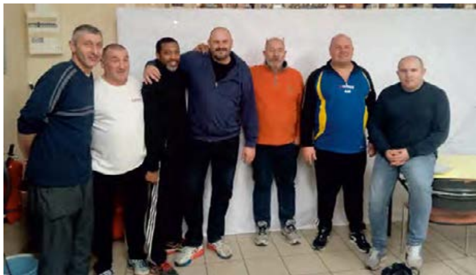
Les membres du bureau