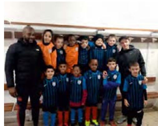
Nouveaux maillots de nos jeunes et de nos seniors